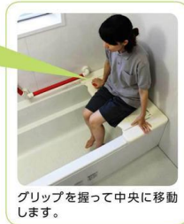
グリップを握って中央に移動します。

グリップを握って身体を引き寄せるのが難しい方でも、グリップに掌を乗せてプッシュアップできます。