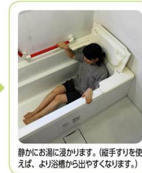
静かにお湯に浸かります。(縦手すりを使えば、より浴槽から出やすくなります。)

商品のご注文・お問い合わせはこちらまでご連絡下さい→TEL 076-269-1555