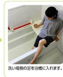
洗い場側の足を浴槽に入れます。