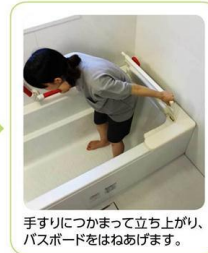
手すりにつかまって立ち上がり、バスボードをはねあげます。