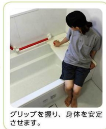
グリップを握り、身体を安定させます。