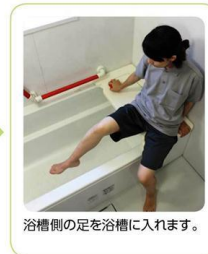
浴槽側の足を浴槽に入れます。